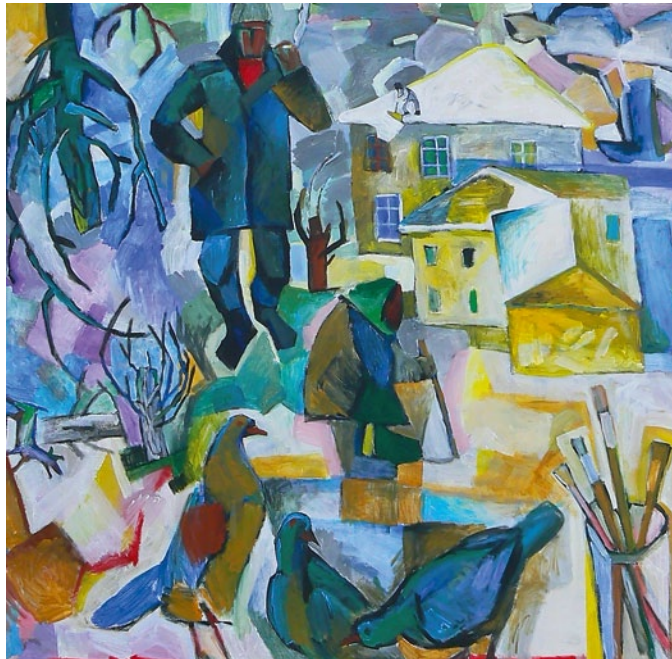
Зима в старом районе, 110×110, холст, акрил, 2008

Кристина Абрамичева, куратор галереи «Х-МАХ», Уфа