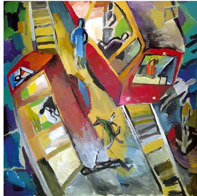
Трамвай №9, 105×100, картон, акрил, 2009